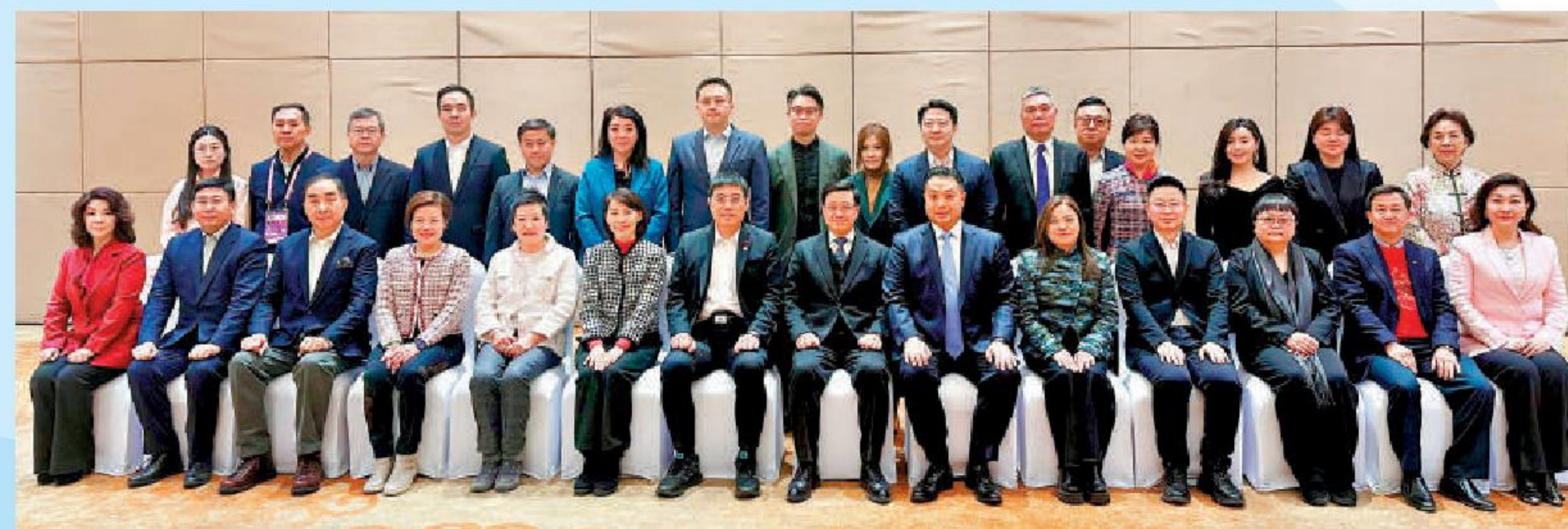
▲李家超（前排左八）與在東北三省工作和營商的港企代表和港人合照。