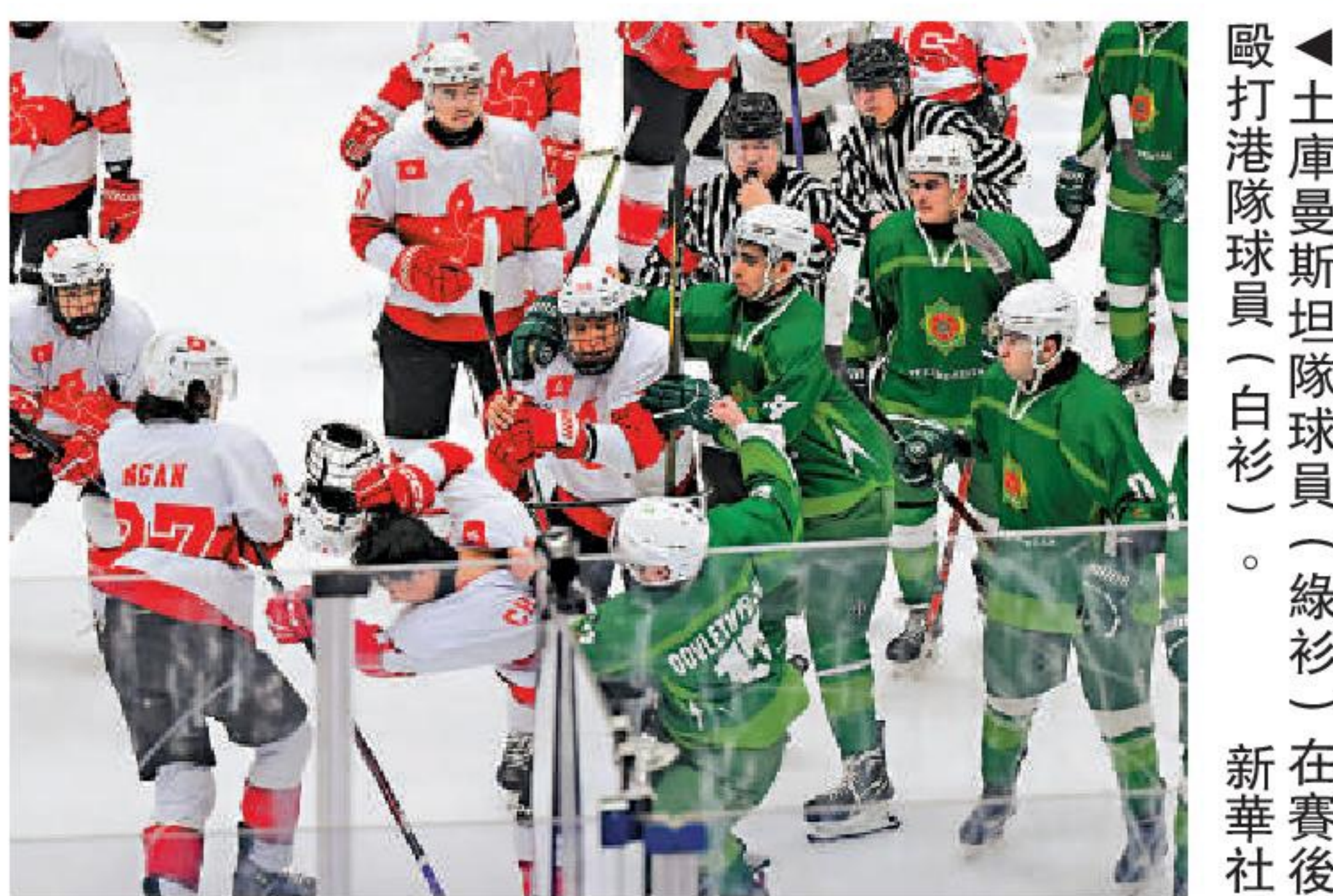
▲土庫曼斯坦隊球員（白衫）在賽後毆打港隊球員（綠衫）。