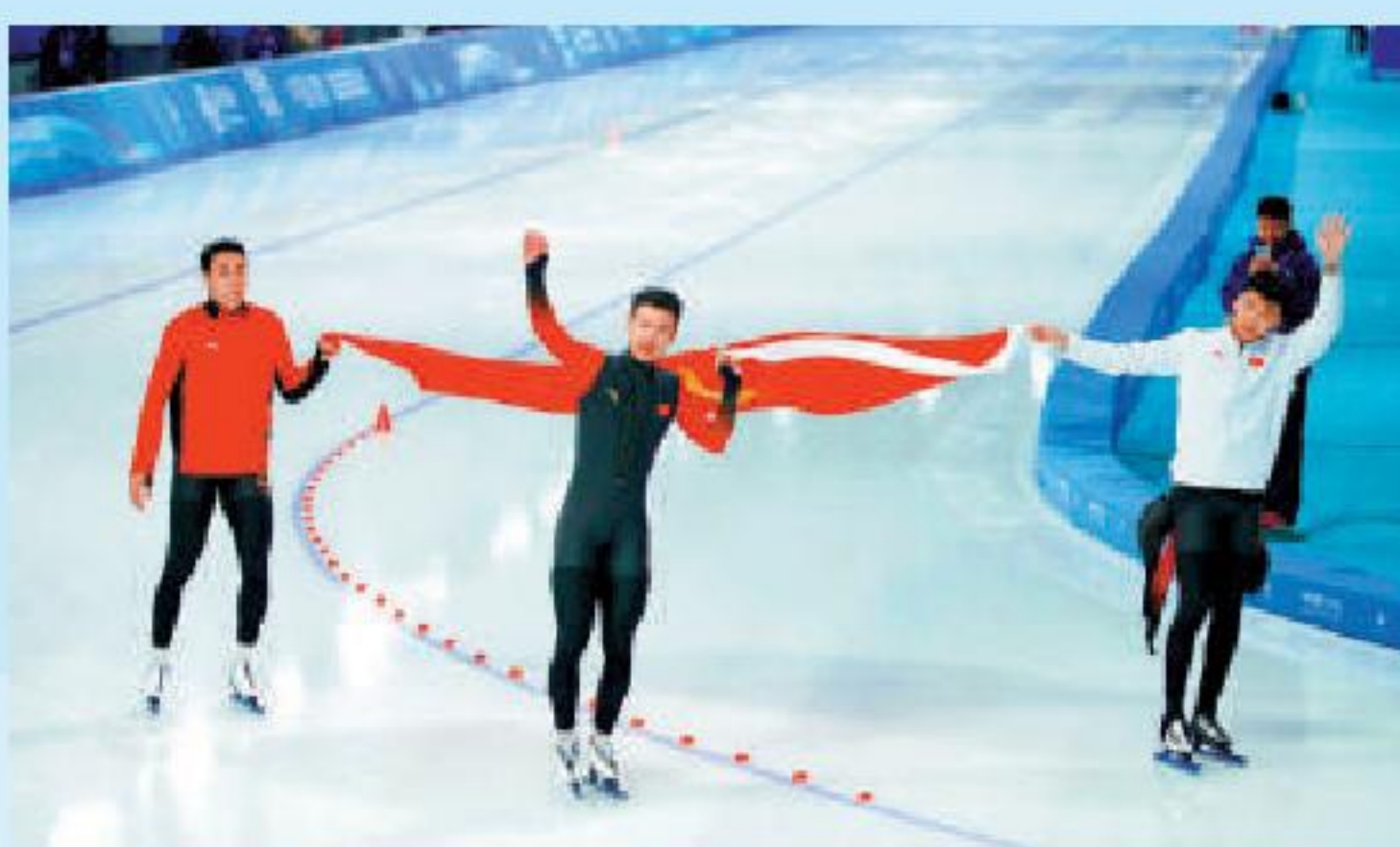
▲右起：高亭宇、寧忠岩、廉子文在比賽後慶祝。